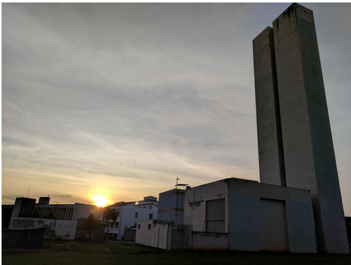
“Pôr do Sol no CEPETRO”